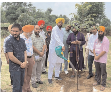
कैबिनेट मंत्री स.कुलदीप सिंह धालीवाल माहिर बुखारी में पौधारोपण कर वन मां उत्सव मनाते हुए।

अमृतसर 6 अगस्त 2024-- आज पंजाब सरकार द्वारा मनाए गए राज्य स्तरीय वन महा उत्सव के अवसर पर पंजाब सरकार में कैबिनेट मंत्री कुलदीप सिंह धालीवाल और हरभजन सिंह ईटीओ ने अमृतसर जिले में अपने-अपने निर्वाचन क्षेत्रों में लोगों के साथ मिलकर सार्वजनिक स्थानों पर पौधे लगाए और प्रोत्साहित किया। लोगों को अधिक से अधिक पौधे लगाने के लिए प्रोत्साहित किया कैबिनेट मंत्री स.कुलदीप सिंह धालीवाल ने अपने हलके के गुरु घर मेहर बुखारी में पौधे लगाए और प्लान किया कि 15 अगस्त से पहले वह अजनाला हलके में करीब डेढ़ लाख पौधे लगाए। उन्होंने लोगों को अपने घरों और खेतों में अधिक से अधिक पेड़ लगाने के लिए भी प्रोत्साहित किया। श्री धालीवाल ने कहा कि हम पिछले कुछ दिनों से सरकारी स्थानों पर