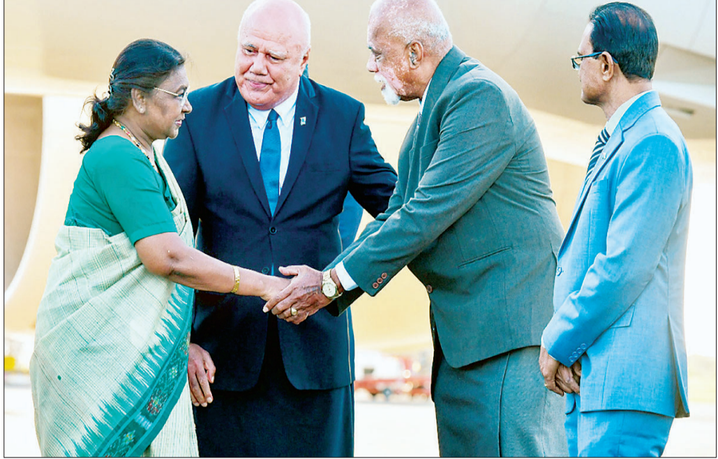
सोमवार को फिजी गणराज्य के नादी हवाई अड्डे पर पहुंची राष्ट्रपति द्रौपदी मुर्मू।

बढ़ोतरी हुई। इससे किसान सशक्त हुआ है और उसे कृषि आदानों के लिए समय पर धन मिलने लगा है। कृषि मंत्री ने कहा कि खेती की जमीनों में धांधली रोकने और हेरा फेरी पर रोक लगाने के लिए सरकार किसानों की डिजिटल आईडी बनाने की दिशा में आगे बढ़ रही है। इस आईडी को किसानों की जमीनों से जोड़ दिया जाएगा। उन्होंने कहा कि इससे जमीनों की धांधली रोकी जा सकेगी और राजस्व अधिकारियों की मनमानी पर भी रोक लगेगी। इस आईडी से आपदा आने या फसल होने की स्थिति में वास्तविक किसान को मदद मिल सकेगी। उन्होंने कहा कि फसल की बुआई और नुकसान का रिकार्ड उपग्रहीय प्रणाली से होगा और खेत में नुकसान होने की स्थिति में सीधे वास्तविक किसान को मदद दी जा सकेगी।